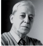
des Amis de Mohammed Dib